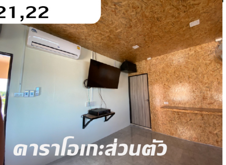
ดาราริเอะส่วนตัว